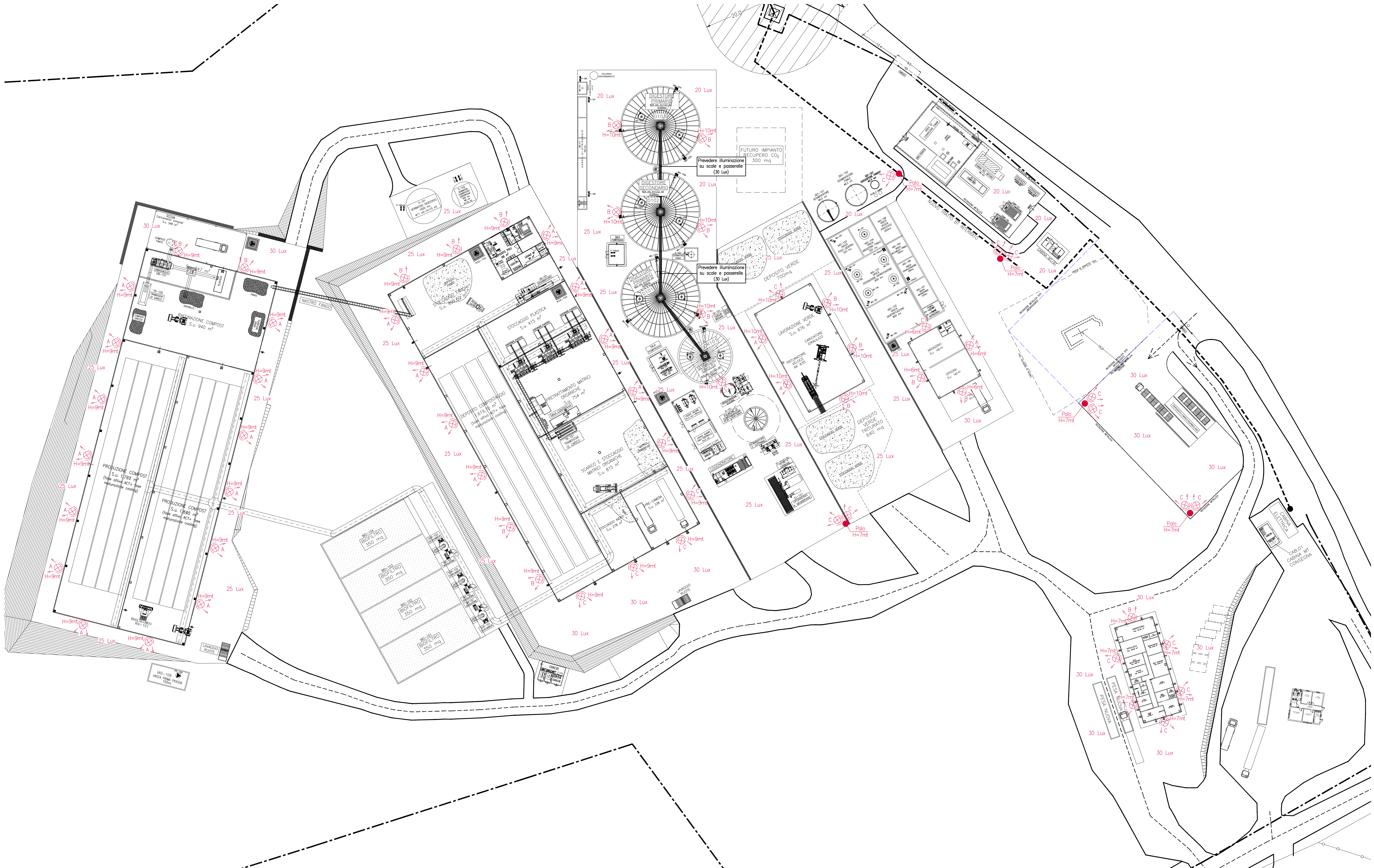
PLANIMETRIA ILLUMINAZIONE scala 1:200